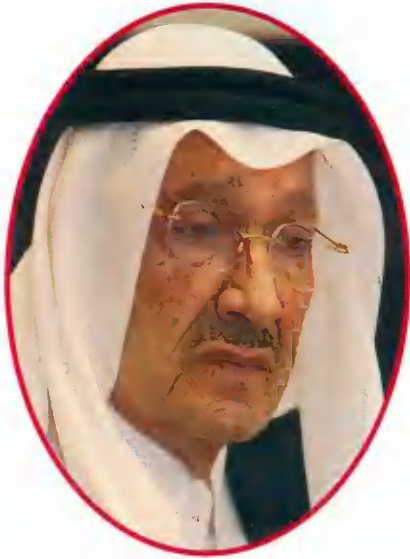
الأمير طلال بن عبد العزيز آل سعود