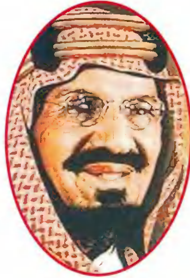
الملك عبد العزيز آل سعود

بمبادرة من صاحب السمو الملكي الأمير طلال بن عبد العزيز رئيس المجلس العربي للطفولة والتنمية، ومن منطلق اهتمام سموه بقضايا الطفولة والتنشئة والمواطنة باعتبارها قضايا ذات أولوية لتنشئة الطفل في البلدان العربية بغرض تكوين إطار فكري إسترشادي لتنمية الأطفال في المجتمعات العربية، يقوم المجلس العربي للطفولة والتنمية بإنشاء جائزة في مجال البحث الاجتماعي والتربوي لتقديم دراسات وبحوث علمية حول قضايا الطفولة والتنمية ودعم حق الطفل في المشاركة والحماية.